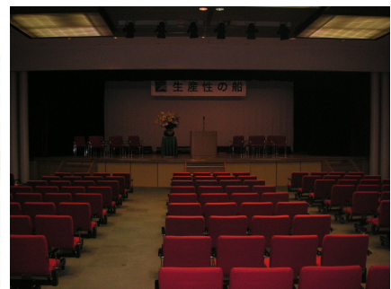
船内大会议场（可容纳500人）